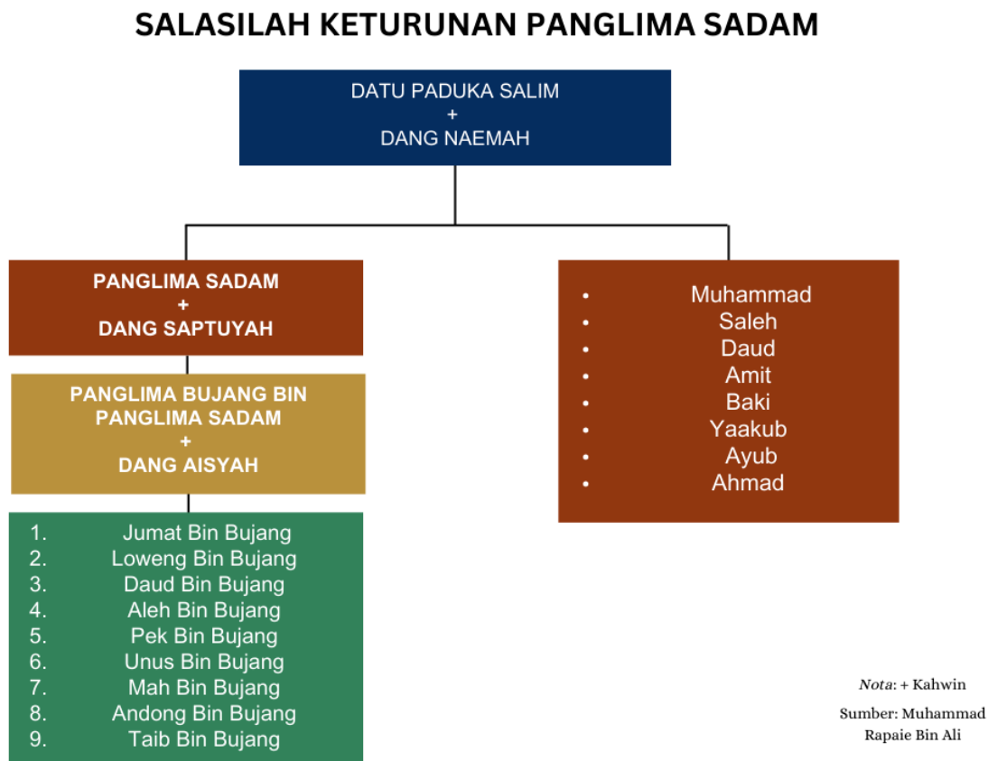
Rajah 1 Salasilah Keturunan Panglima Sadam